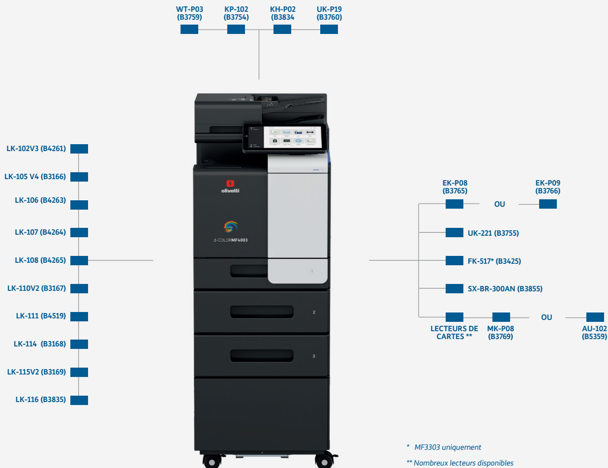
d-Color MF3303 (B3741) d-Color MF4003 (B3742)