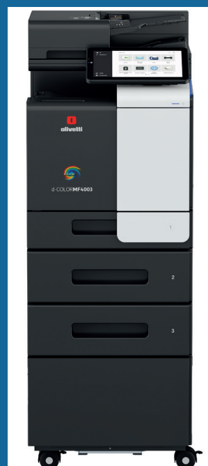
CONFIGURATION AVEC MEUBLE ET DEUX MAGASINS PAPIER OPTIONNELS