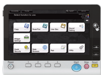
Écran tactile couleur 10,1 pouces avec authentification NFC