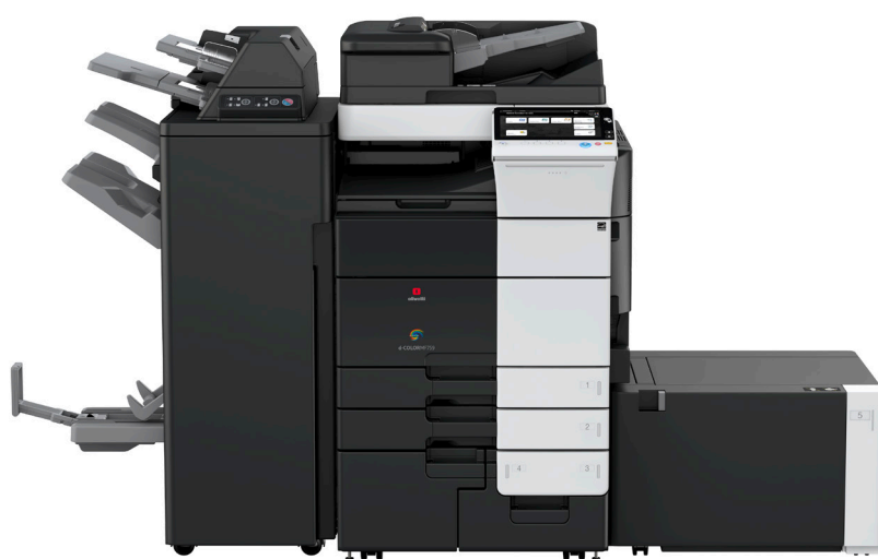
Configuration avec module de finition FS-537SD équipé de l'inserteur hors four PI-507, Pont RU-515 et magasin papier grande capacité latéral LU-205